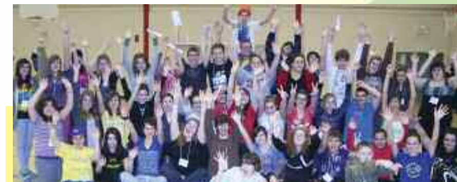
La FJFNB a présenté le premier colloque sur la santé Racines de l'espoir à la polyvalente Cité des jeunes A-M-Sormany d'Edmundston, en novembre 2010. Cet événement découle de l'un des projets dévoilés par le RAOS.

Créer et mettre à jour une liste de professionnels de la santé francophones disponibles, localement ou via la télésanté (Outils);