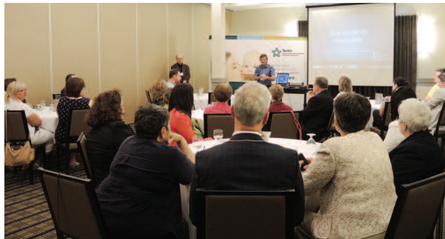
La SSMEFNB était fière d'accueillir le président de la Société Santé en français du Canada, Aurel Schofield.

La SSMEFNB a poursuivi sa collaboration avec le comité consultatif des langues officielles du Réseau de santé Horizon. L'organisme collabore aussi étroitement à l'organisation du Forum provincial sur la santé mentale et au 6 e Colloque provincial sur le cancer du sein, deux événements majeurs qui auront lieu en octobre prochain.